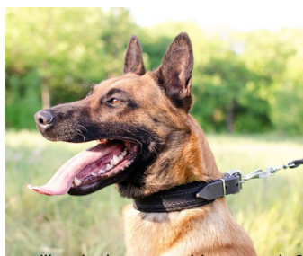
Photo: collier design pour chien en cuir 30 mm