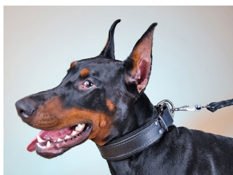
Photo: collier en cuir au design classique 25 mm