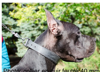
Photo: collier en cuir feutré 40 mm