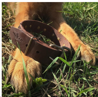
Photo: collier chien cuir de marque FDT Artisan