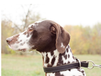
Photo: collier de type étrangleur en cuir naturel