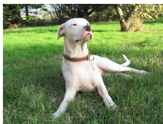
Photo: collier étrangleur en cuir