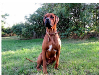
Photo: collier étrangleur chien en cuir