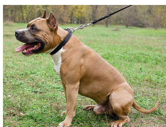
Photo: collier étrangleur cuir au chien molosse