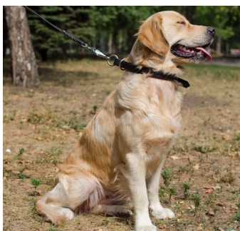
Photo: collier étrangleur fait en cuir haut de gamme