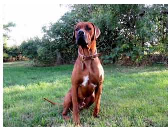
Photo: collier étrangleur chien en cuir