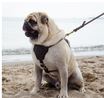
Photo: harnais cuir pour petit chien