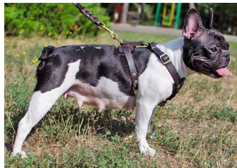
Photo: harnais confortable en cuir pour petit chien