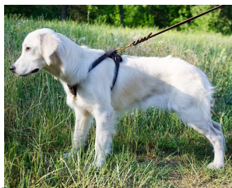
Photo: harnais petit chien fait en cuir