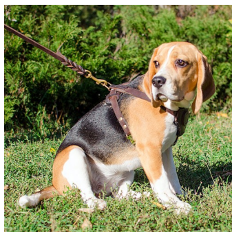
Photo: harnais cuir petit chien