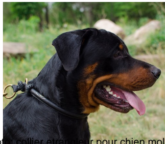
Photo: collier etrangeur pour chien molosse