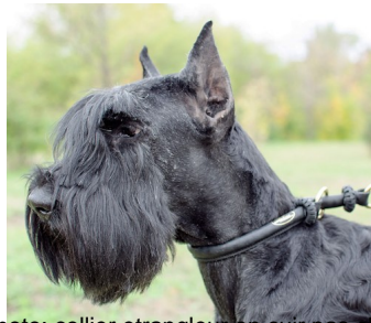
Photo: collier etrangeur en cuir pas cher