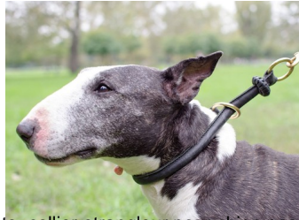
Photo: collier etrangeur pour chien pas cher