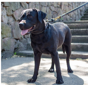
Photo: collier étrangleur pas cher