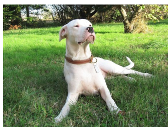
Photo: collier étrangleur en cuir