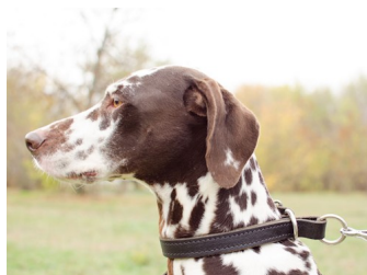
Photo: collier de type étrangleur en cuir naturel