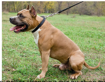
Photo: collier étrangleur cuir au chien molosse