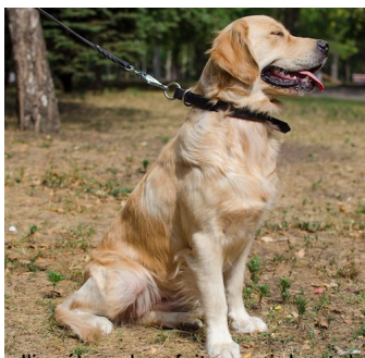
Photo: collier étrangleur fait en cuir haut de gamme