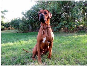
Photo: collier étrangleur chien en cuir