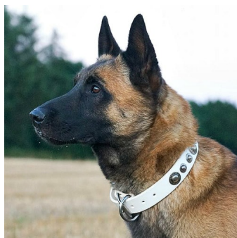
Photo: collier décoré de plaques rondes pour chien malinois