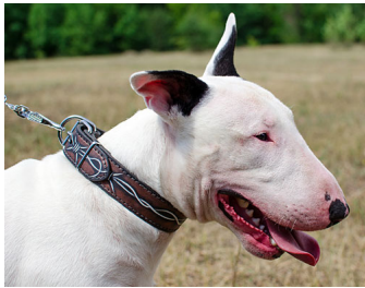
Photo: collier chien solide à la peinture du fil barbelé