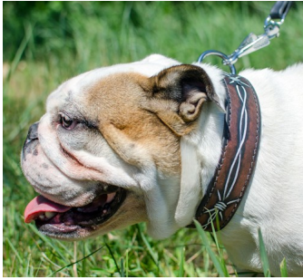
Photo: collier chien solide avec une peinture "Fils de fer barbelés"