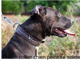
Photo: collier chien peinture solide